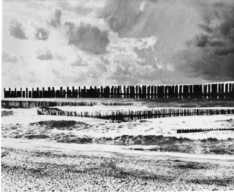
Montage Domburg.

Das Austarieren solcher Kontraste entspricht klassischer Kompositionsweise. Die Folge: Jeder weitere Eingriff in das Bild müsste sich daran orientieren. Auf der Basis elektronischer Datenspeicherung lässt sich aus diesem Bild allerdings eine andere Reihe von Kompositionen erzeugen, mehr einem Raster als ordnendes Prinzip folgend. Unter Beibehaltung der Anzahl der Pixel verändert sich das Bild beim Zoomen. Die quadratischen Formen der Pixel werden schnell sichtbar und so zur Grundlage des Bildes. Die Graustufen bleiben prinzipiell erhalten, treten aber kontrastreicher in den Vordergrund und geben dem Bild zusammen mit den quadratischen 'Bausteinen' einen konstruktiven Charakter.