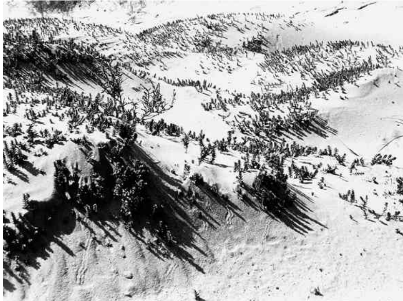
Bernd Scheffer. Kleine Sandfläche (2006)

Eine Interpretation ging in Richtung Schneelandschaft mit Skispuren, die aber nach Auskunft des Fotografen Spuren eines Käfers waren. Als ich nach längerer Zeit auf das Foto zurückgreifen wollte, war die Webseite in eine Fotogalerie umgewandelt und die Fotografien für eine Ausstellung unter den Begriffen Strukturen, Spuren, Zeichen neu geordnet. Strukturen werden hier offensichtlich als visuelle Formen von Organisation und somit als ästhetische Phänomene wahrgenommen. Interpretationen sprachlicher Art lenken unter diesen Bedingungen vom Ästhetischen ab, da das Visuelle der Bilder in Erzählungen zu verschwinden droht. Mir scheint der Gebrauch der Bilder dem Bildermachen adäquater zu sein. Das In-Beziehung-Setzen der Bilder schafft konkrete Kontexte innerhalb eines Universums der Bilder. Vergleiche schaffen Beziehungen über Ähnlichkeiten, und sie ermöglichen, Unterschiede zu konstatieren. Gregory Bateson hat seine Vorstellung von Ästhetik kurz und prägnant for-